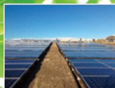
エータイム神戸第一発電所 [神戸市西区]